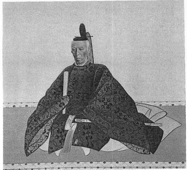
松平勝成(13・15代)肖像画